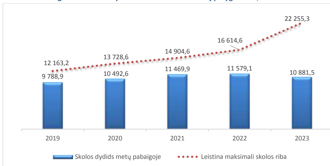
2 diagrama. Savivaldybės skolos ir skolos limitų palyginimas, tūkst. Eur