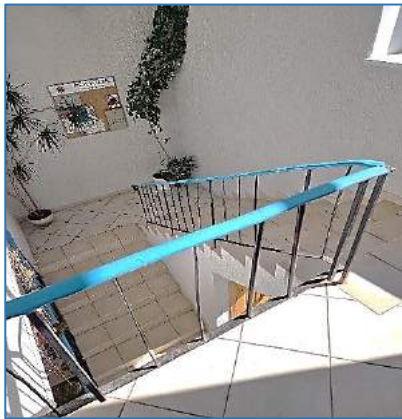
4 pav. Saldučiškio seniūnija