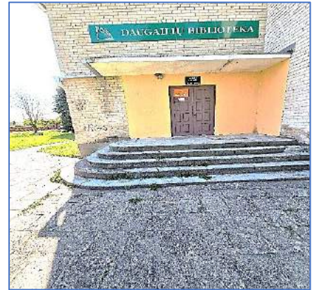
6 pav. Daugailių biblioteka